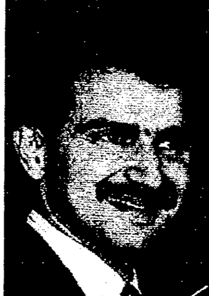
الوليد بن طلال